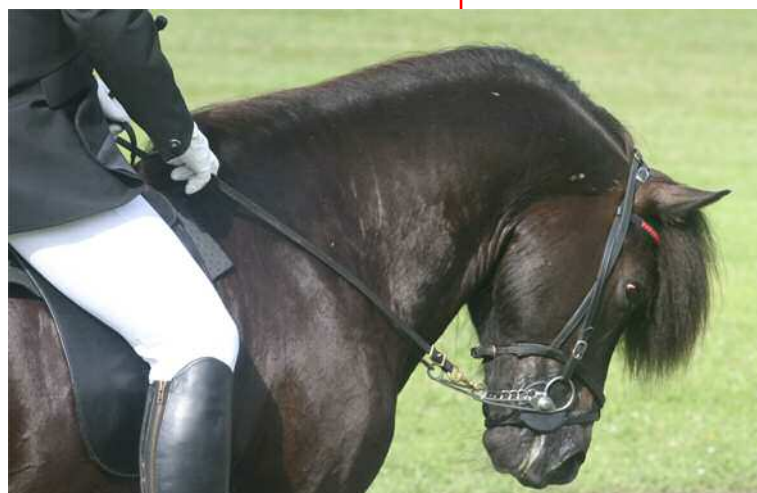
Falscher Knick, Hyperflexion der Halswirbelsäule, banger, nach hinten gerichteter Blick: Hilflosigkeit bei Pferd und Reiter?