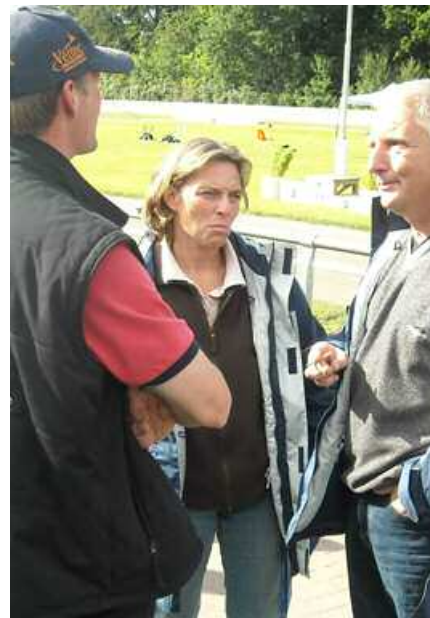
Unten: Ein weiterer Teil beim Fachsimpeln am Ovalbahnrand.