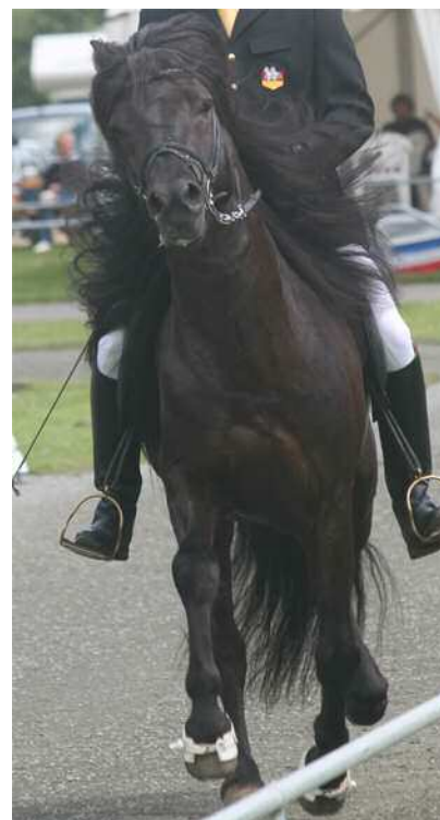
Schief gewickelt: Das Pferd wehrt sich und steht nicht an den Hilfen. Kann es da noch Noten aus dem 8er-Bereich geben?

Es gibt Reitanlagen, wo die Richterhäuschen an der langen Seite postiert sind. Auf dem Kronshof z. B. oder auf der Anlage von Karly Zingsheim. Unser werter Präsident hat die Nützlichkeit so angeordneter Richterposten also längst erkannt. - Es wird Zeit, dieses System jetzt flächendeckend zu installieren, damit die Richter sehen, was sie richten sollen.