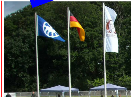
Die tolle Anlage auf dem Gestüt Osterbyholz ließ für die Reiter fast keine Wünsche offen.

Das Team hat sich dann auf der Camping-Wiese (übrigens ohne Wasseranschluss) dank des freundlichen Parkplatzhüters häuslich einrichten dürfen.