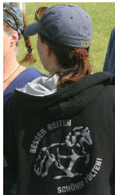
Oben: Ein Teil der Jury bei der Arbeit