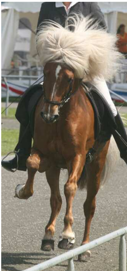
Erst von vorn sieht man, dass das gar kein richtiger Galopp ist.

Es ist völlig klar, dass der Richter in der Ovalbahnmitte benachteiligt ist. Er