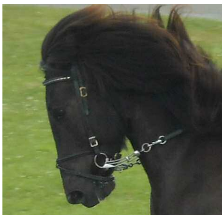
Der unreflektierte Einsatz der Islandtrens zeigt, was aus den Pferden werden kann: Automaten.

Die Bedienung dieser 'black box' gaukelt dem Menschen vor, er könne die ihm kräftemäßig überlegene Kreatur beherrschen. Das mag zumindest für das Reiten von abrufbaren Lektionen gelten, mein Dr. Bohnet. Ein Dialog zwischen Mensch und Pferd sei so kaum möglich, vielleicht ist er auch gar nicht erwünscht.