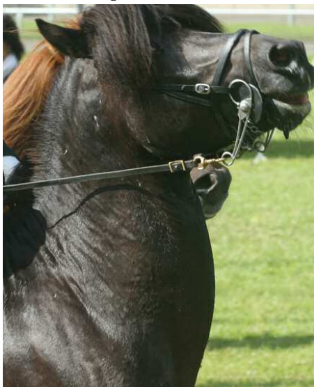
Die Islandtrens „beißt“ zu. Dem Pferd ist das Maul mit dem kombinierten Reithalter zugeschnürt, der Reiter hält es in eisener Faust. Das Pferd lernt: es gibt keinen Ausweg. Die Folge bei fortwährender Penetration - Resignation.

Es sei ein chronischer Stresszustand, erklärt der australische Verhaltensforscher McLean. Bei akut auftretendem Stress aktivieren Stresshormone den Fluchreflex – das Pferd rennt davon und beendet dadurch die gefährliche Situation.