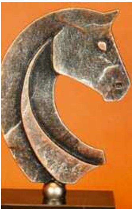
Die Trophäe: garantiert ohne Unterhalts.

Engagierte Freizeitreiter, ambitionierte Gelegenheitssportreiter und nicht-(mehr)-rei-