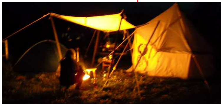
Der Ort langer, nächtlicher Diskussionen über das am Tag Gesehene.