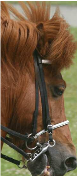
Wenn der Richter das Pferd an der langen Seite direkt vor der Nase hat, fällt ihm vielleicht auch auf, dass die Reiterin ständig an einer durchgefallenen Kandare riegelt.

sieht weniger, er hört weniger und er merkt einfach weniger, weil er sich selbst auch ständig bewegen muss. - Entweder sitzend auf einem Drehstuhl